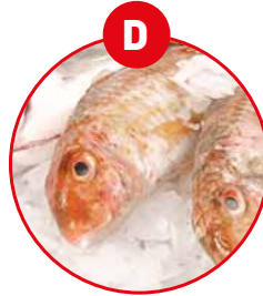
D FISCH UND DARAUS GEWONNENE ERZEUGNISSE (AUSSER FISCHGELATINE)