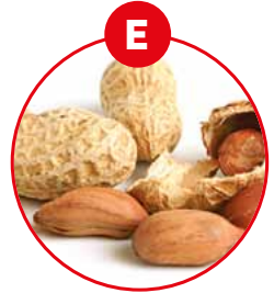
E ERDNÜSSE UND DARAUS GEWONNENE ERZEUGNISSE