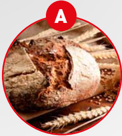
A GLUTENHALTIGES GETREIDE UND DARAUS GEWONNENE ERZEUGNISSE

Allergeninformation gemäß Codex-Empfehlung