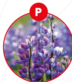
P LUPINEN UND DARAUS GEWONNENE ERZEUGNISSE