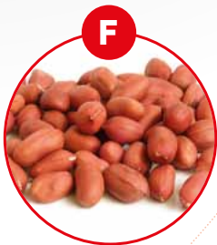
F SOJABOHNEN UND DARAUS GEWONNENE ERZEUGNISSE