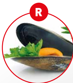
R WEICHTIERE WIE SCHNECKEN, MUSCHELN, TINTENFISCHE UND DARAUS GEWONNENE ERZEUGNISSE