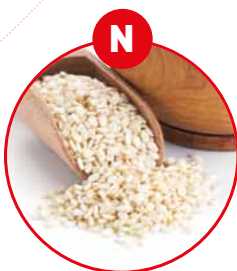
N SESAMSAMEN UND DARAUS GEWONNENE ERZEUGNISSE