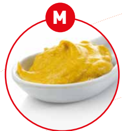
M SENF UND DARAUS GEWONNENE ERZEUGNISSE