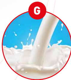
G MILCH VON SÄUGETIEREN UND MILCHER- ZEUGNISSE (INKLUSIVE LAKTOSE)