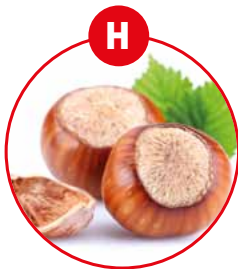
H SCHALENFRÜCHTE UND DARAUS GEWONNENE ERZEUGNISSE