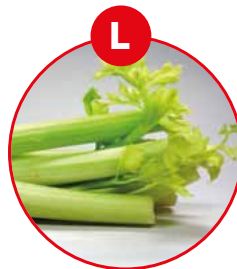
L SELLERIE UND DARAUS GEWONNENE ERZEUGNISSE