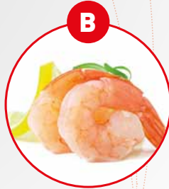
B KREBSTIERE UND DARAUS GEWONNENE ERZEUGNISSE